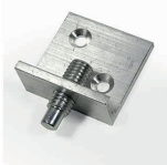
Système de suspension