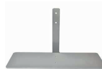
Pied de support latéral