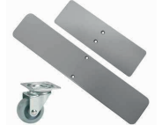
Pieds plats avec ou sans roues